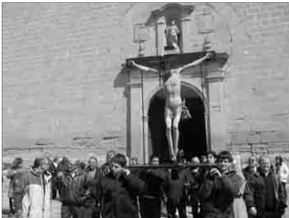
Los Quinto, costaleros tradicionales del Cristo

Junta Directiva de la Cofradía de Cristo de Zareco