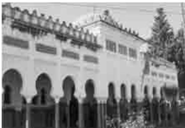
Mezquita Grande de Alcazarquivir