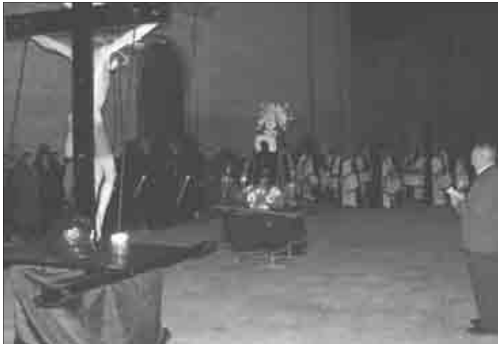
Encuentro de Cristo y su Madre Dolorosa, en la Plaza Mayor.