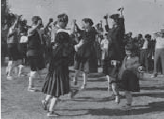
Romería del año 1960: el grupo de jotas de Luna subió ese año a Monlora para amenizar la jornada con sus bailes.