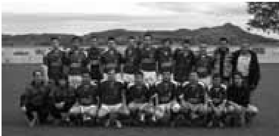
CLUB DEPORTIVO LUNA