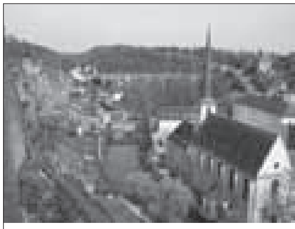
“Ciudad de Luxembourg”